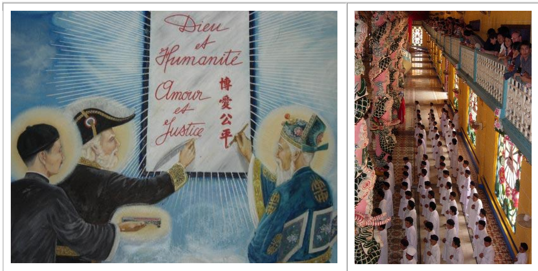
A gauche, trois des " saints " de la secte, dont un certain Victor Hugo, reconnaissable ici avec son chapeau d'académicien. A droite, rassemblement lors de l'office de midi dans le chœur de la " cathédrale " très rococo de Tây Ninh.